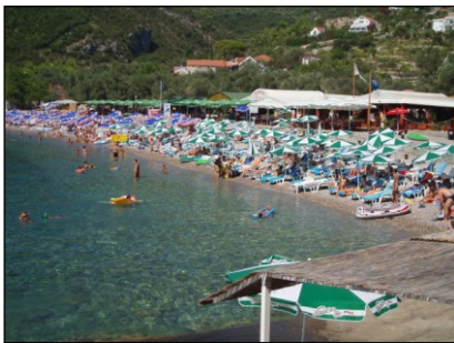
Båttur til stranden "Žanjice" via "the blue caves" (Montenegro)

Alle turer er forbeholdt minimum deltakere, der forhåndspåmelding og fakturering/innbetaling utføres i Norge før avreise.