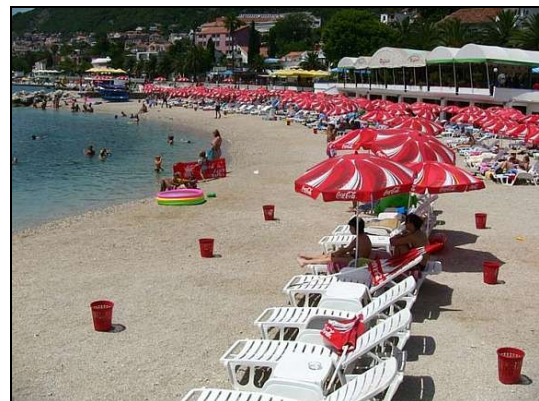
Rafaelo beach i Herceg Novi

Herceg Novi og Igalo har til sammen litt under 20.000 innbyggere. De ligger i den nordre delen av Montenegro og bare 10 km fra den kroatisk grensen. Området er kjent for sin lange strandpromenade med sine mange badeplasser. Her finnes gode restauranter og bra shoppingmuligheter.