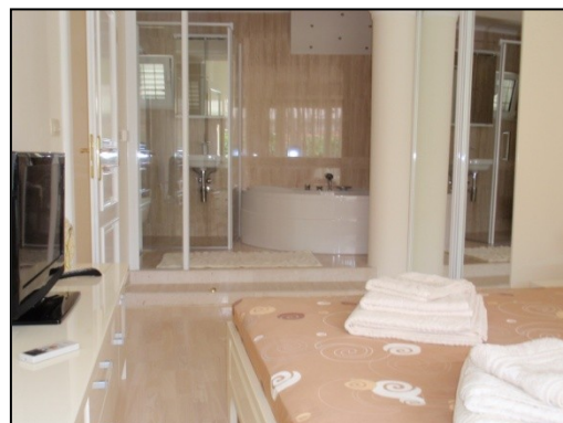
Soverom 2 (m/ bad)