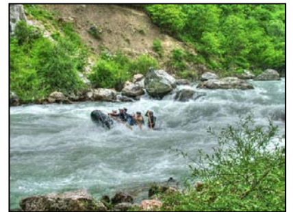
Rafting i elva "Tara"