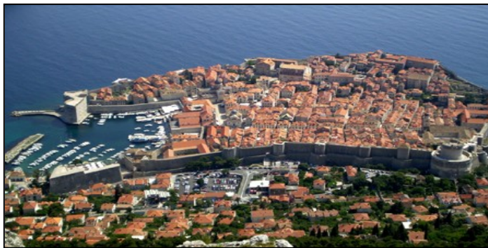
Gamlebyen i Dubrovnik (Kroatia)