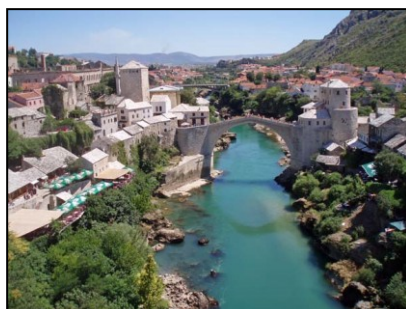
Historiske byen Mostar (Bosnia)