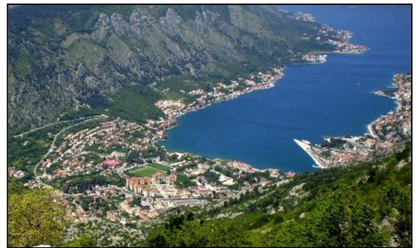
Gamlebyen i Kotor (Montenegro)