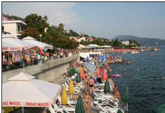
Herceg Novi – Igalo, fra promenaden langs sjøen

Klimaet er svært spesielt i dette distriktet og er definert som subtropisk. Dette på grunn av fjordsystemet og beskyttelse av de høye fjellene som ruver langs hele fjorden. Her finnes alle typer sydlige frukttrær, også banantrær finnes i dette området.