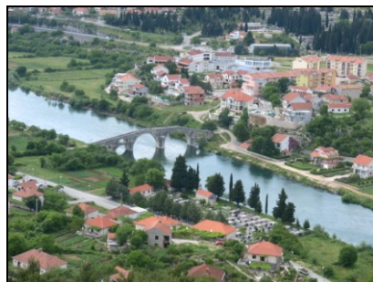
Byen Trebinje (Bosnia)