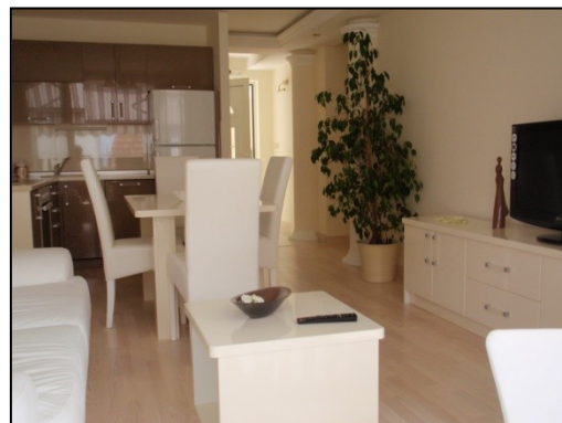
Stue / Kjøkken